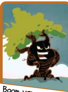
Boom van een vent